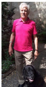
Alain Boutet Président de l'UNADEV