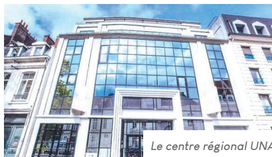
Le centre régional UNADEV Lille

Retrouvez toutes les adresses des centres régionaux de l'UNADEV sur www.unadev.com/lassociation/les-centres-regionaux/