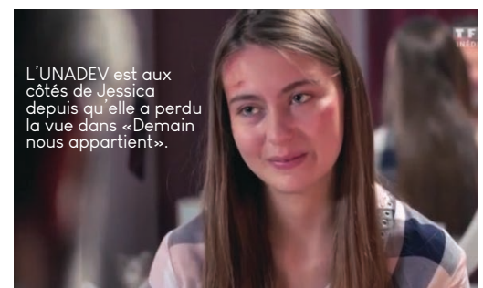
L'UNADEV est aux côtés de Jessica depuis qu'elle a perdu la vue dans «Demain nous appartient».

L'UNADEV a intégré le scénario de la nouvelle série TV populaire «Demain nous appartient», programmée quotidiennement sur TF1 à 19h20. Ce partenariat médiatique a pour objectif de porter la cause du handicap visuel auprès du plus grand nombre. Dans la série, le personnage de Jessica a perdu la vue suite à un grave accident de bus. L'UNADEV joue pleinement son rôle en apportant des solutions et un accompagnement au personnage non-voyant. Pour l'UNADEV, ce partenariat est également un moyen de mettre en lumière les différentes aides techniques qui existent pour faciliter la vie des personnes déficientes visuelles, telles que les assistants vocaux et de présenter son magazine Lumen, le premier magazine gratuit d'informations sur le handicap visuel, à destination des professionnels, des familles et des personnes déficientes visuelles. L'association vise ainsi changer les regards sur le handicap visuel et provoquer une prise de conscience sur cette problématique. En plus d'une diffusion en France sur TF1, «Demain nous appartient» est également programmée à l'étranger : sur «La Une» en Belgique, sur RTS Un en Suisse romande, en Italie sur Fox Life, et au Québec sur Séries+.