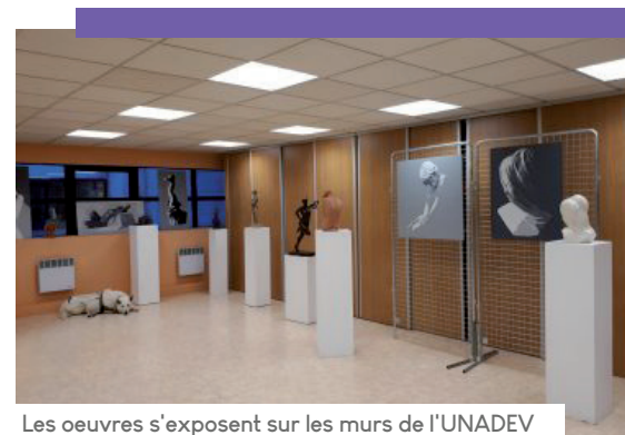
Les œuvres s'exposent sur les murs de l'UNADEV